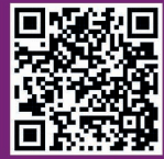
Aplicação para Móveis "Step Out, Macao" (iPhone)