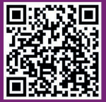
Aplicação para Móveis "Step Out, Macao" (Android)